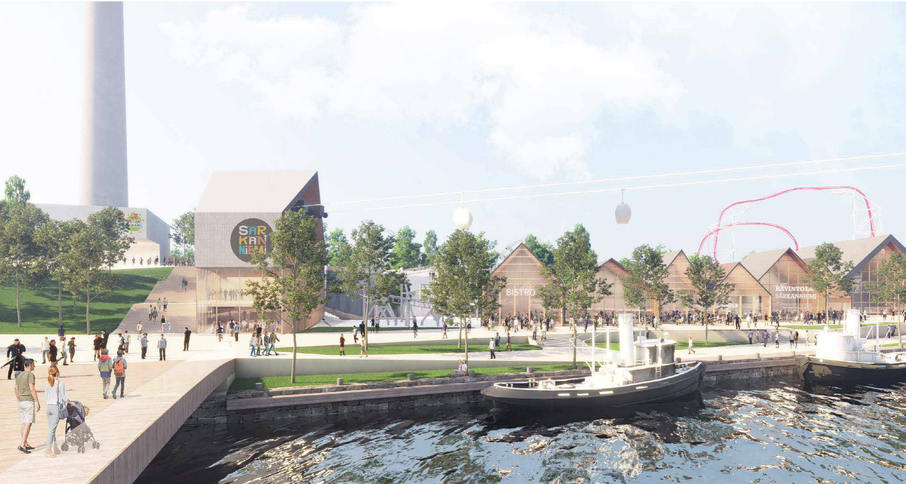
NÄKYMÄ SÄRKÄNNIEMEN RANTA-ALUEELLE