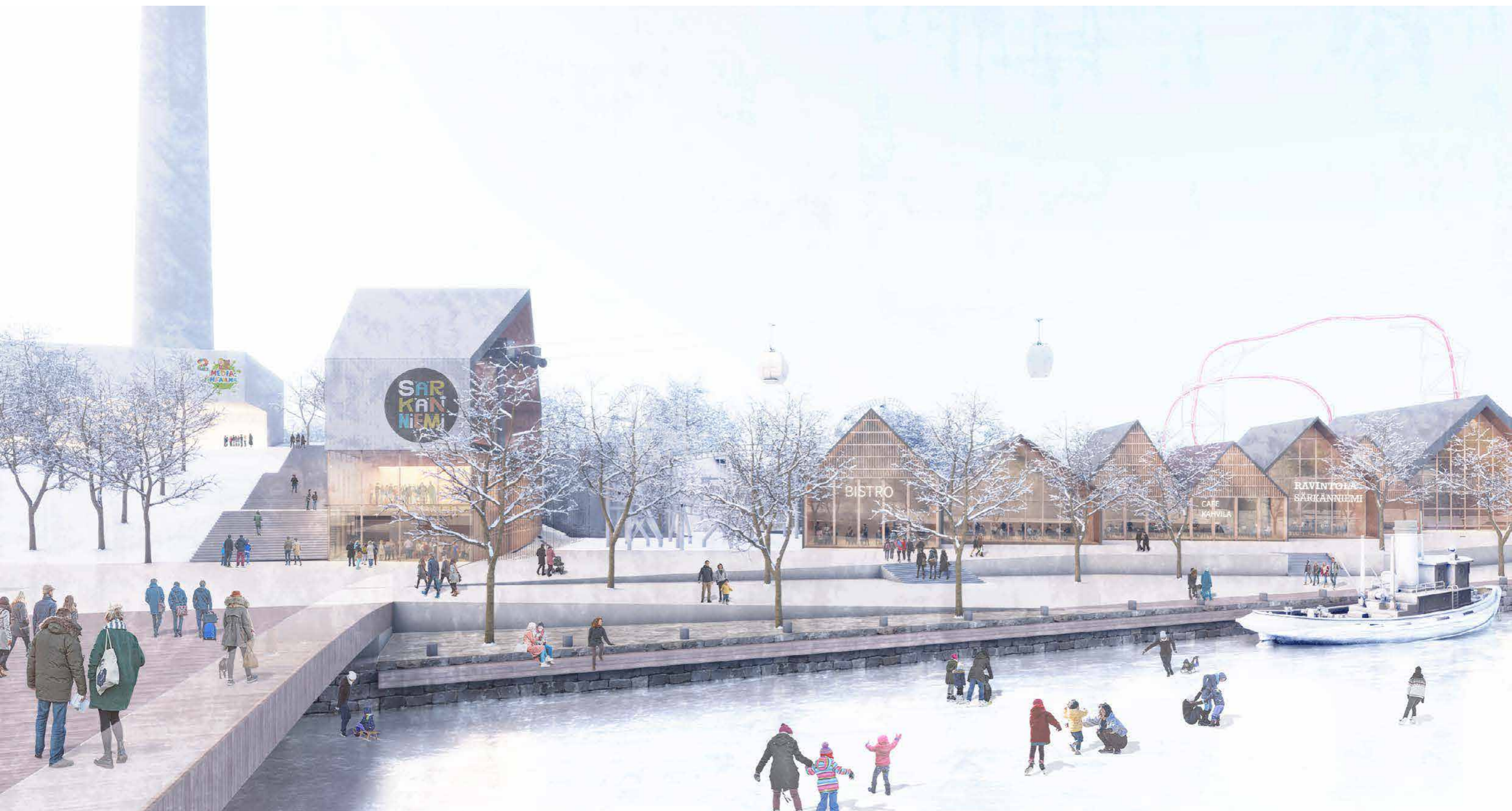
NÄKYMÄ SÄRKÄNNIEMEN RANTA-ALUEELLE TALVELLA