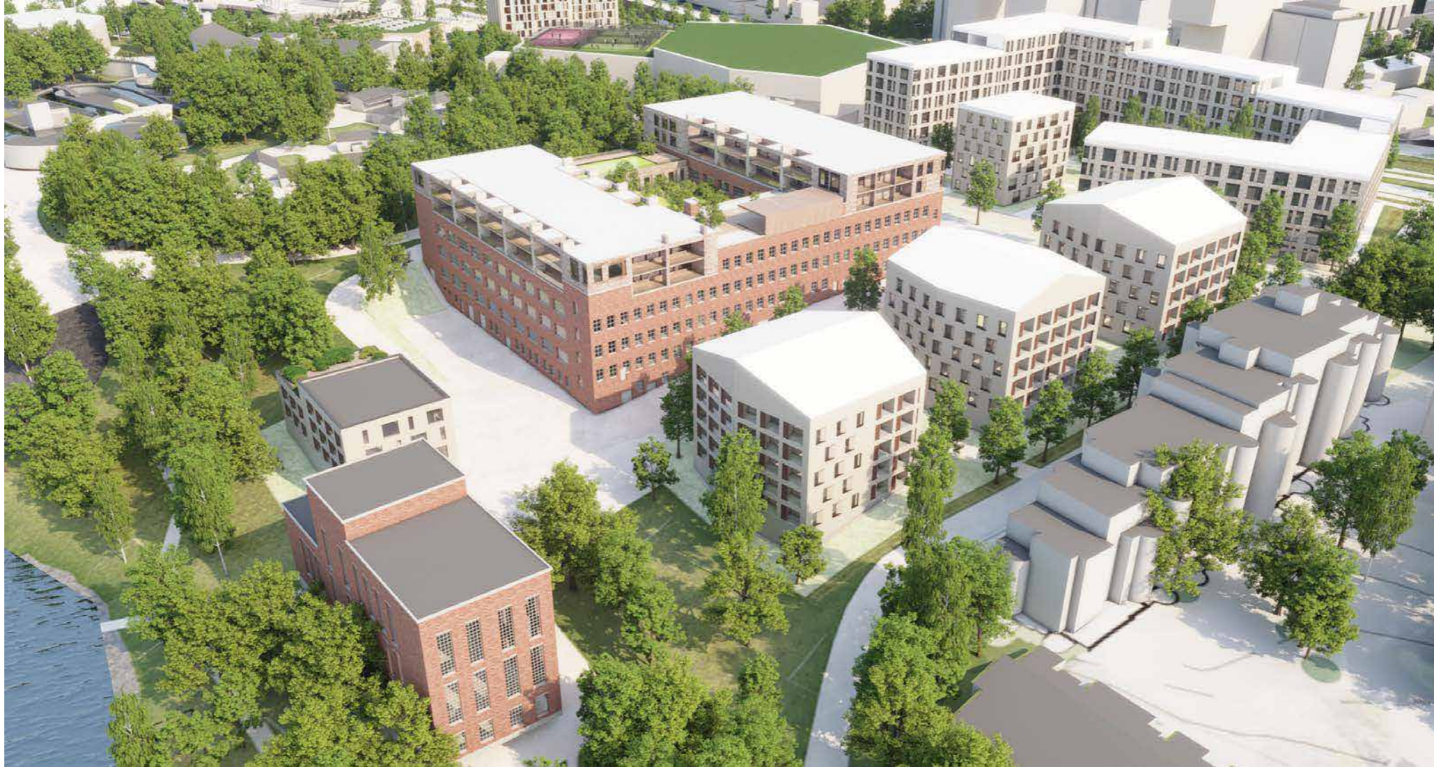
NÄKYMIÄ TRIKOOTTEHTAAN ALUEELTA